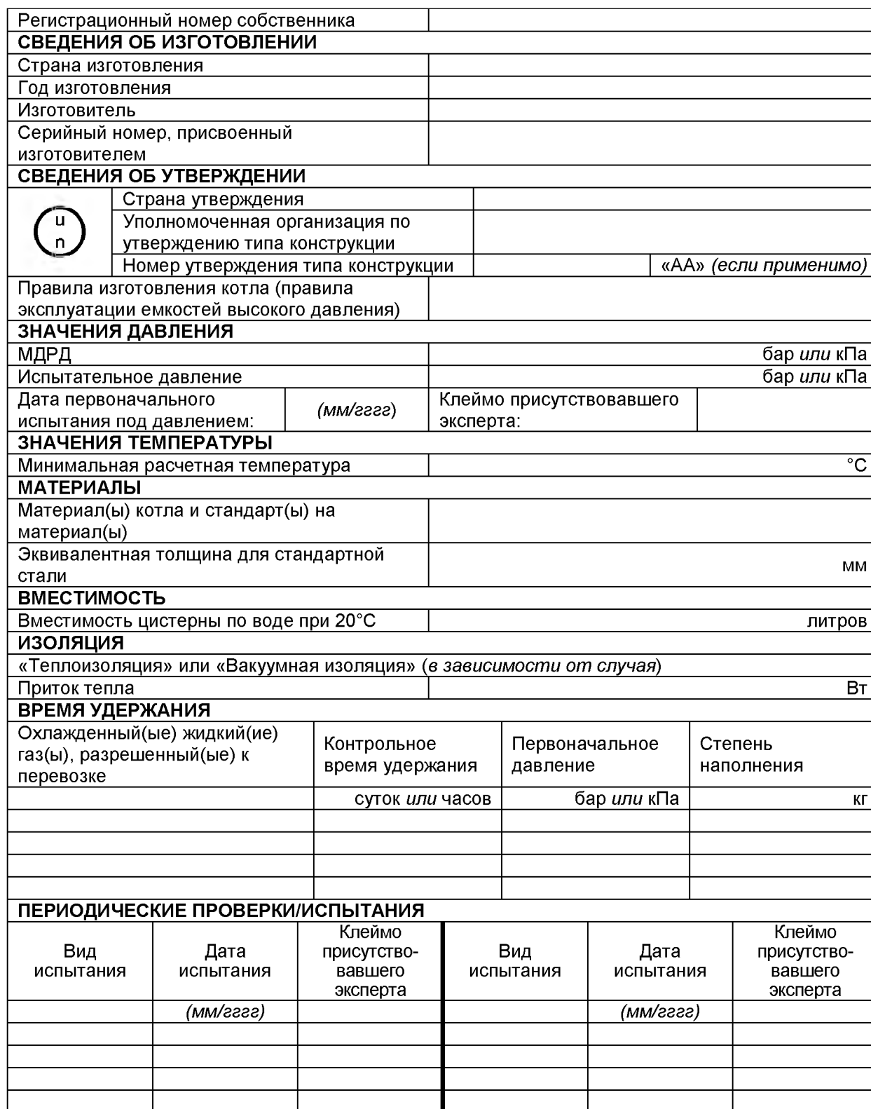
Рис. 6.7.4.15.1: Пример маркировки на идентификационной табличке