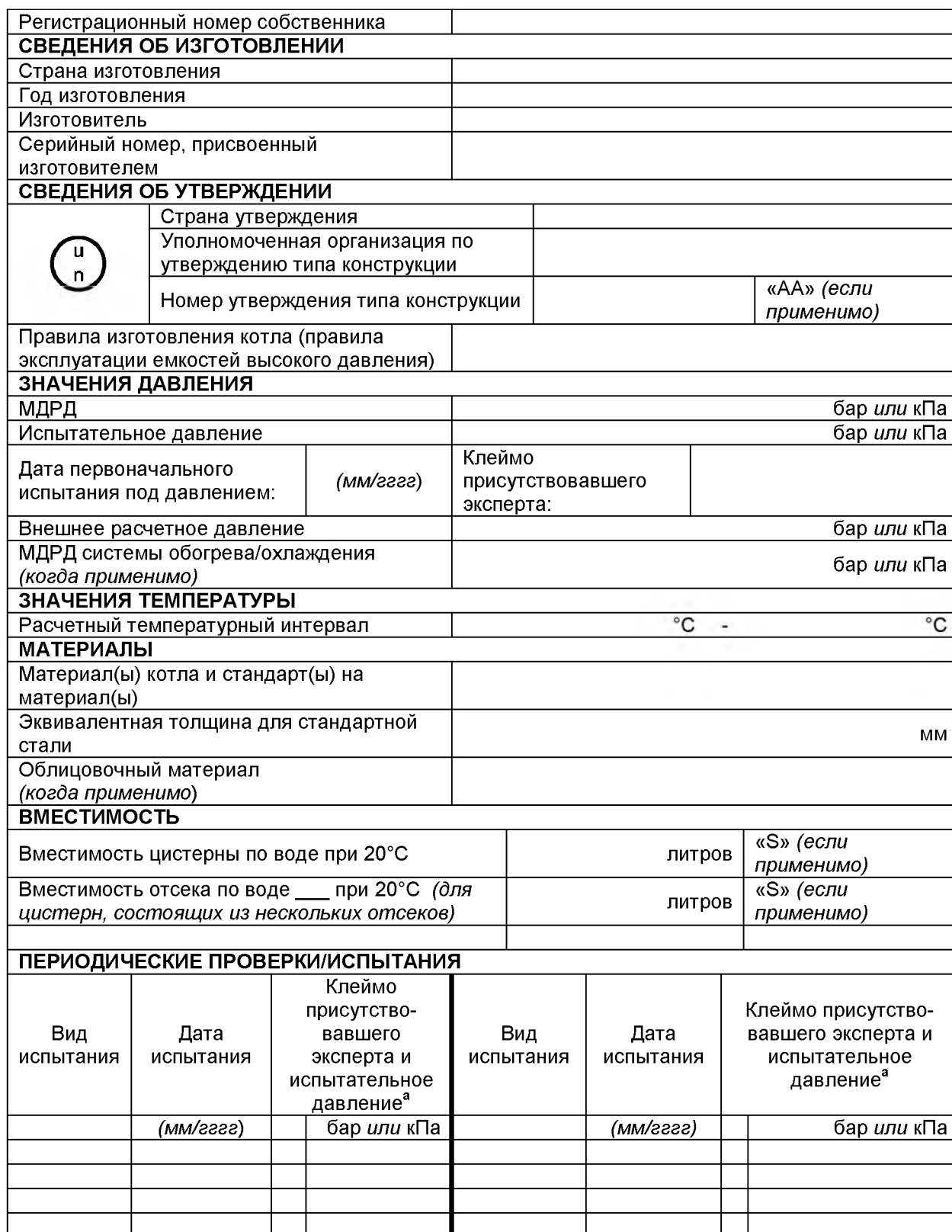
Рис. 6.7.2.20.1: Пример маркировки на идентификационной табличке