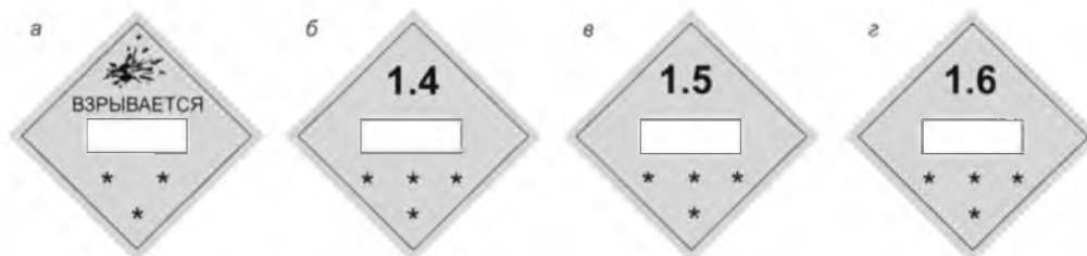
Рис. 2. Знаки опасности для взрывчатых материалов:

3.2.3. Знаки опасности в зависимости от подклассов ВМ выполняются в соответствии с рис.2. Цвет фона указанных знаков опасности — оранжевый. Высота цифр 1.4, 1.5, 1.6 составляет 30 мм, толщина — 5 мм. Надпись «Взрывается» при международных перевозках наносится на английском, французском или испанском языке.